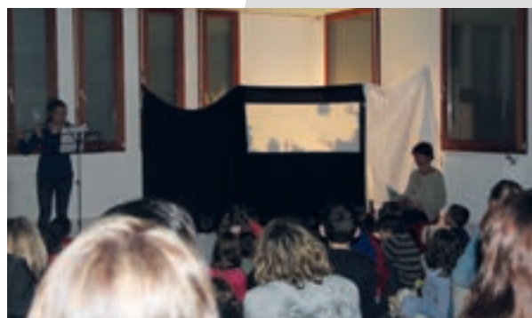
Les belles histoires en pyjama, avec ombres chinoises, lecture et musique.